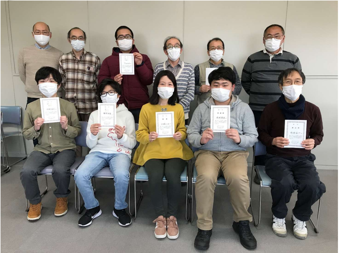
図 1 参加者のみなさん