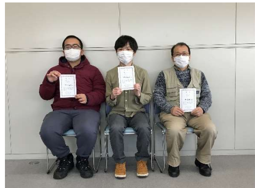
図 3 Aクラス入賞者