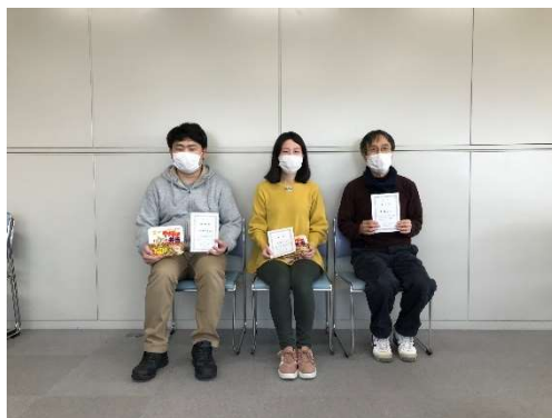
図 2 オープン入賞者