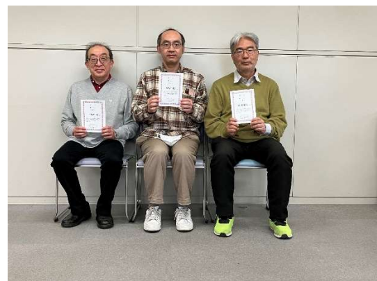
図 3 Aクラス入賞者