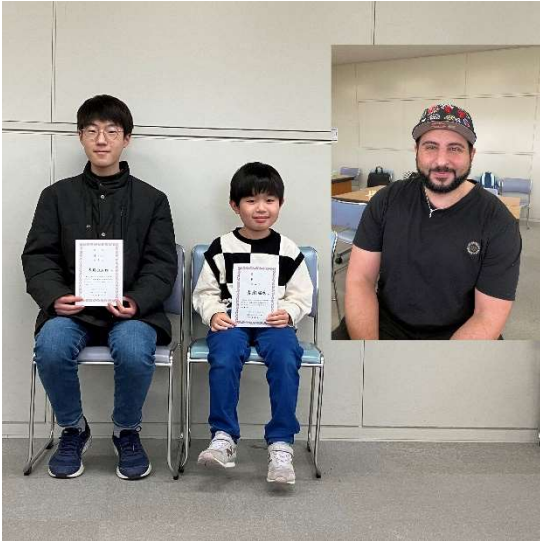
図 4 B クラス入賞者