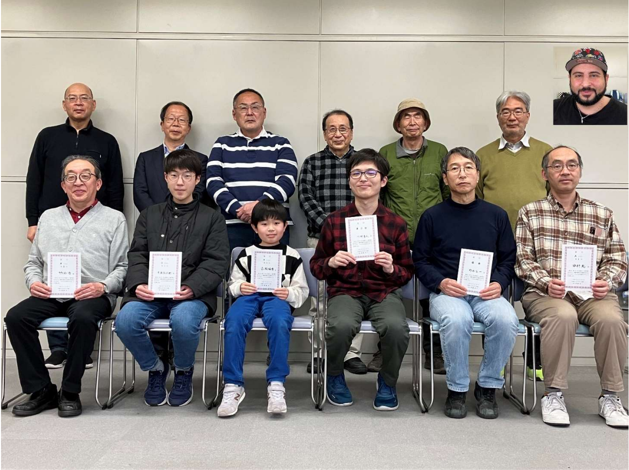
図 1 参加者のみなさん