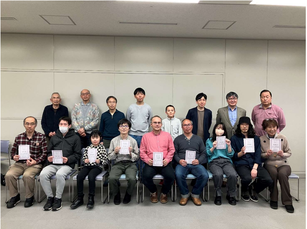
図 1 参加者のみなさん