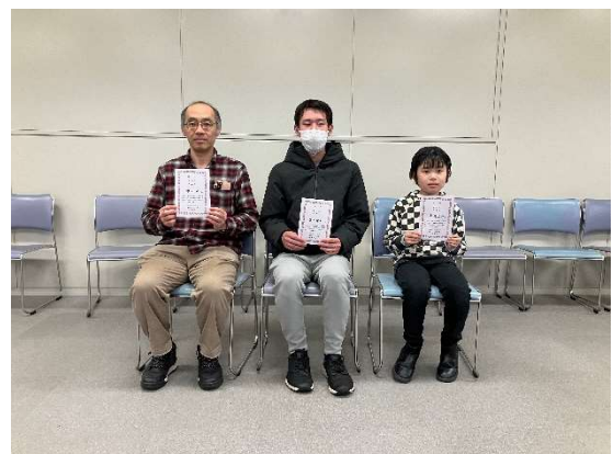
図 3 Aクラス入賞者