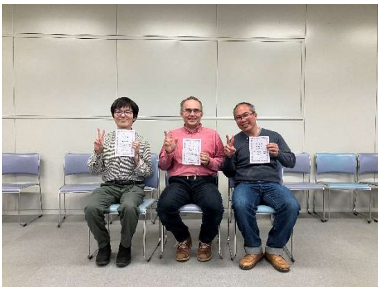
図 2 オープン入賞者