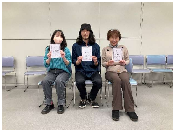
図 4 Bクラス入賞者