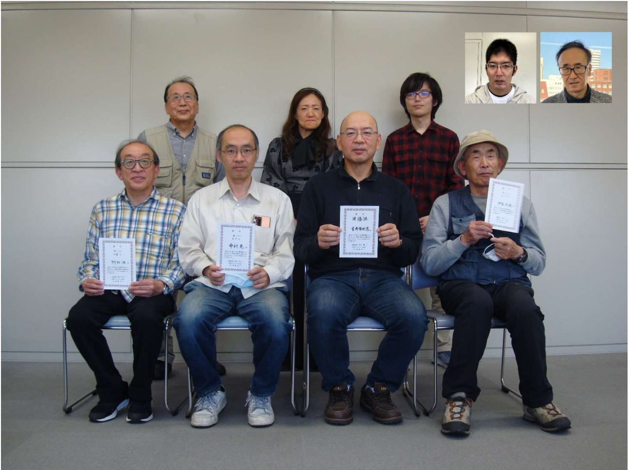
図 1 参加者のみなさん