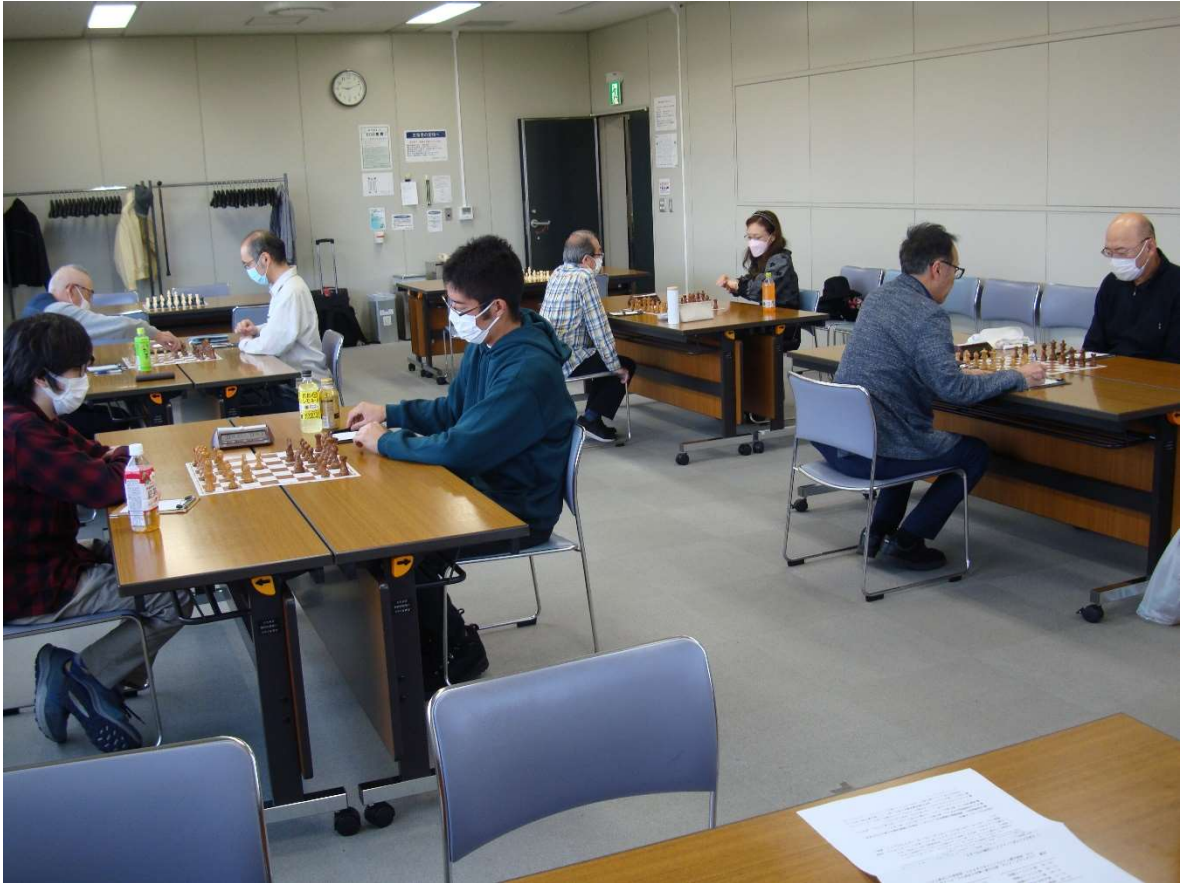
図 3 試合の様子