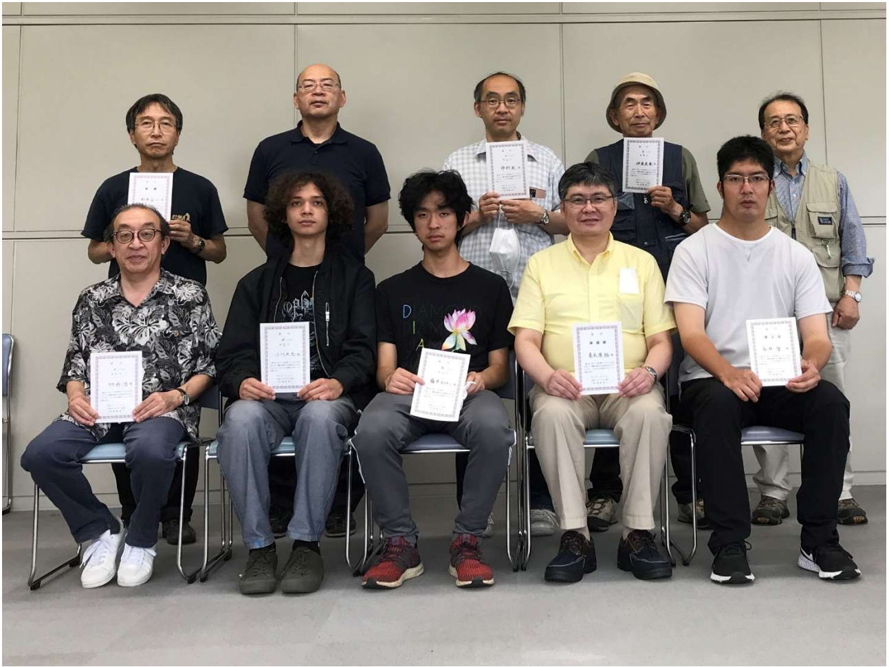
図 1 参加者のみなさん