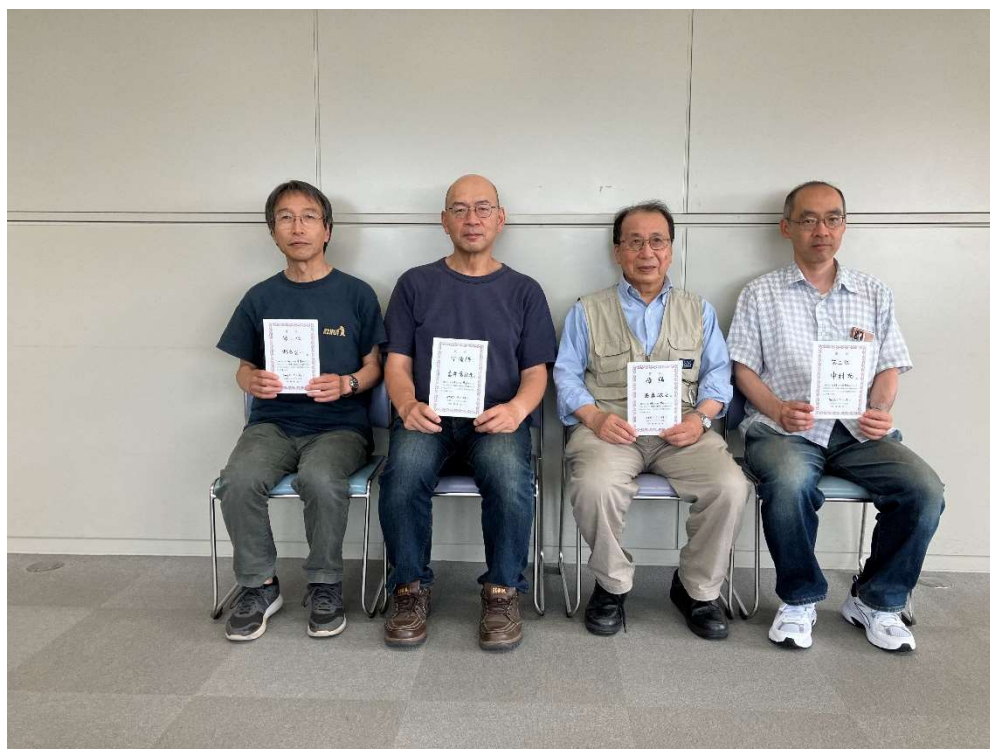
図 2 オープン入賞者