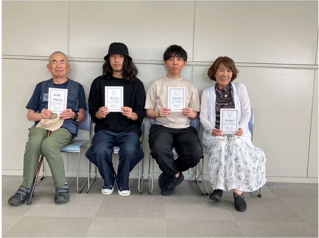
図 3 Aクラス入賞者