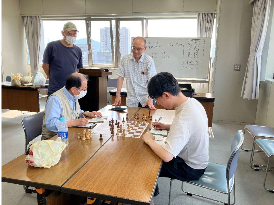
図 4 ゲーム後の検討風景 1