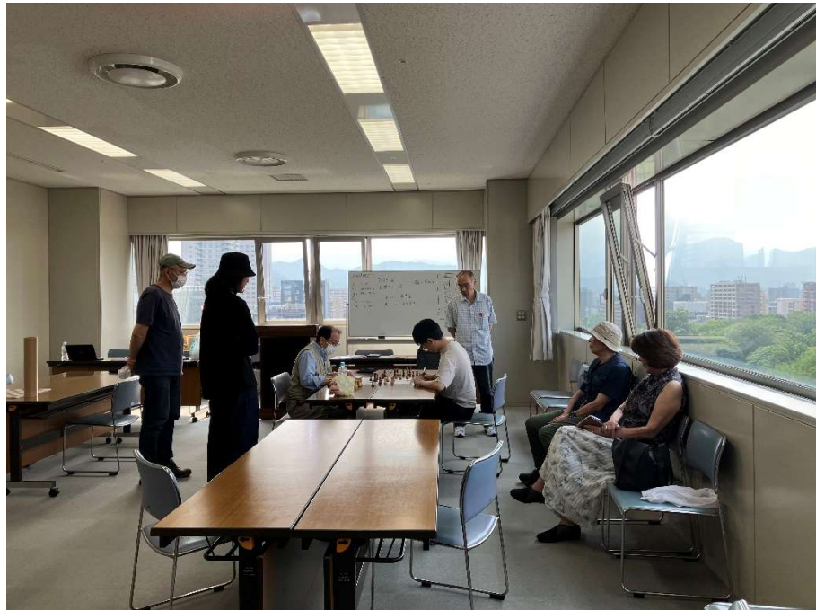
図 5 ゲーム後の検討風景 2