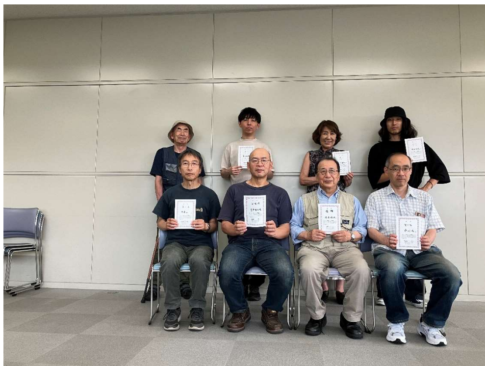
図 1 参加者のみなさん