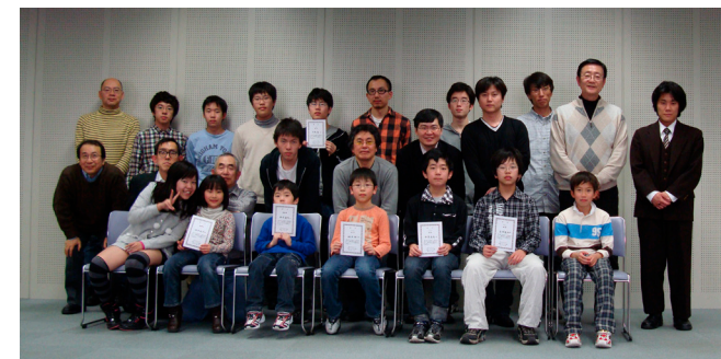
2011年3月27日 北海道チェス選手権大会