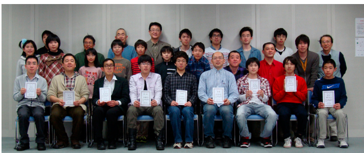
2013年3月31日 北海道チェス選手権大会