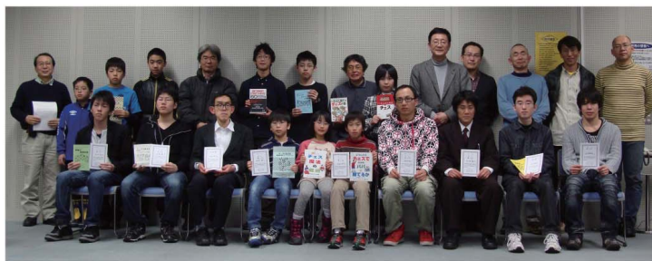
2012年3月25日 北海道チェス選手権大会