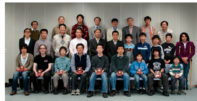
2009年3月29日 北海道チェス選手権大会

前列右から2人目の少年は、Anish Giri。2002年から2007年まで札幌チェスクラブ所属、現在オランダに在住。14歳で当時の世界最年少グランドマスターになり、2016年1月にFIDE Rating 2798で世界第3位を達成。